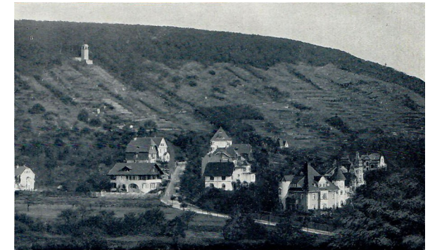
Der Robberg im Jahr 1912. Deutlich sind noch die Weinbauflächen über den gesamten Hügel unterhalb des Bismarckturmes erkennbar.

In den darauf folgenden Jahrhunderten nahmen Ettlinger Bürger zwar die Bewirtschaftung des Robbergs wieder auf, konnten aber nicht mehr an die Erfolge früherer Jahre anknüpfen. Dennoch bildete sich im Jahr 1720 ein Küferzunft und im Jahr 1830 die Zunft der Rebleute, der Verein, aus dem die Robbergfreunde hervorgingen.